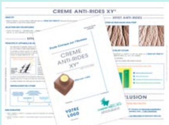
Exemple d'un quatre pages (A3)