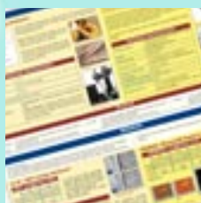
Exemple de poster