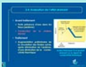
Exemple de diapositive