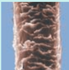
Cheveu - Microscope électronique à balayage